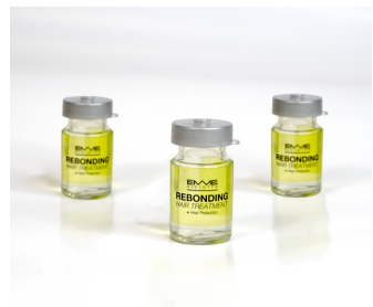
Astuccio con Flacone Nebulizzante capacità 200 ml + 3 fiale da 10ml