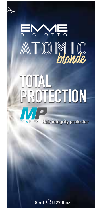
UNIDOSE 8 ml. | 0.27 fl.oz.